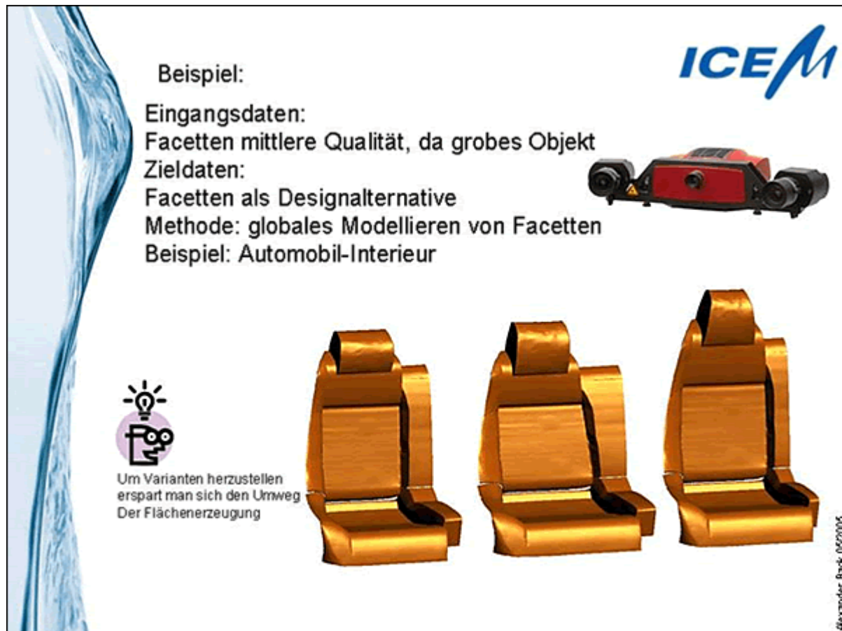
Abb.4: Reverse Engineering, Beispiel Facetten von mittlerer Qualität

Variantenerstellung erfordert nicht unbedingt die Umsetzung in ein Flächenmodell. Die importierten STL-Daten vom Scan-System sind direkt modellierbar. Die modifizierten Facettendaten werden anschließend in Form von STL-Daten exportiert und dienen als Grundlage für die Herstellung des realen Teils. Hierzu werden generative Verfahren oder CNC Fräsmaschinen eingesetzt.