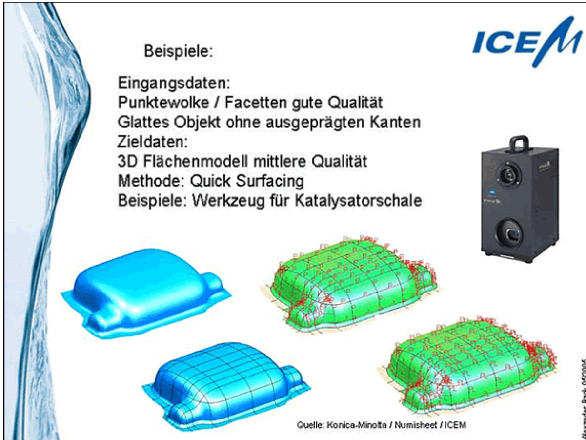
Abb.3: Reverse Engineering, Beispiel Facetten von guter Qualität

Zukünftige Entwicklungen werden mehr oder weniger automatische Feature-Erkennungs-Funktionen bieten, die diesen relativ zeitintensiven Prozess signifikant beschleunigen werden.