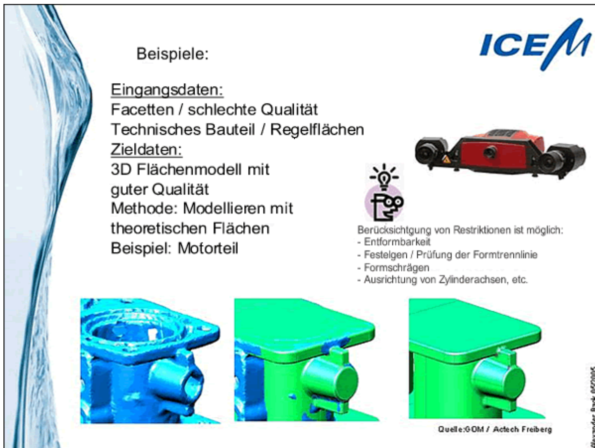
Abb.2: Reverse Engineering, Beispiel Facetten mindere Qualität

Es werden dabei meist keine großen Ansprüche an die Qualität der Ausgangsdaten gestellt. Der Bediener modelliert unter Beachtung der Designabsicht der Vorlage weitgehend frei.